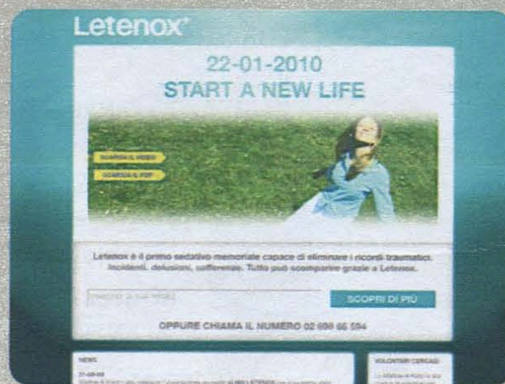
L'HOME PAGE DEL SITO DEDICATO AL LETENOX

L a linea tracciata da Frammenti che divide realtà e finzione è molto sottile . E allora può anche capitare che il Letenox, il misterioso (e inesistente ) farmaco in grado di cancellare dalla memoria di chi lo assume i traumi negativi, venga contestato sui quotidiani nazionali. Supportato da una campagna pubblicitaria creata ad hoc su Current e YouTube, il Letenox è riuscito a trarre in inganno persino i giornalisti del Fatto Quotidiano di Marco Travaglio, che in un recente articolo si sono apertamente schierati contro il suo utilizzo pratico.